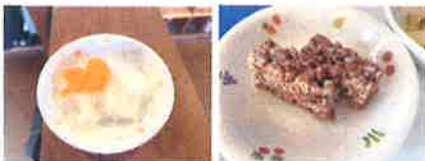
カルピスゼリーにチョコバー！ 手作りおやつも人気です！