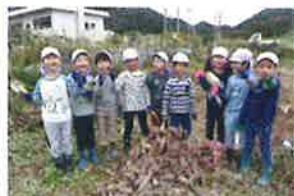
こんなにたくさんのお芋が 掘れました！焼き芋にしたよ。 ホクホクでとってもおいしかったなあ・・・