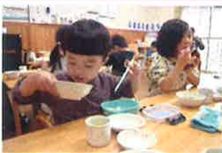
お箸の練習もしているよ。 おかわりもして、大きくなるんだ。