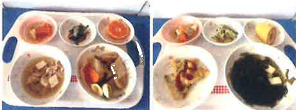
和食に洋食、豊富なメニュー！ ピンクのお皿はアレルギー対応食です。

また、食事のマナーも大切にしており、食材を育てたり、集めたり、料理をしたりと、駆け回ってくれた人に感謝の気持ちを込めて「いただきます」「ごちそうさま」をしたり、正しい姿勢での食事や食具の正しい使い方も身に付くように、子ども達と関わっています。