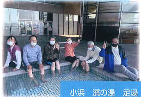
小浜 濱の湯 足湯