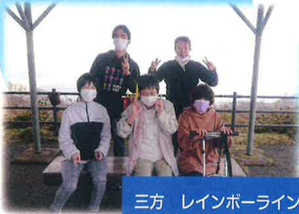
三方 レインボーライン

昨年からのコロナのタイミングをみて、少ない人数で感染防止に気を付けながらグループ活動をおこなっています。