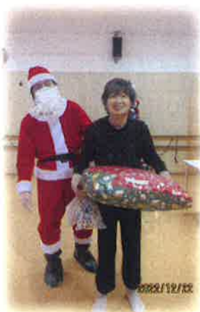
クリスマス会で、大きなプレゼントをもらいました。 苺のケーキもおいしかったです。