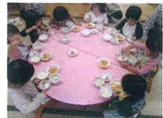
みんなで食べるとおいしいな〜☆☆☆