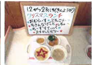
とっても可愛い行事食には毎回園児も大喜びです！