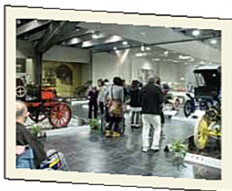
古い車が沢山あるね