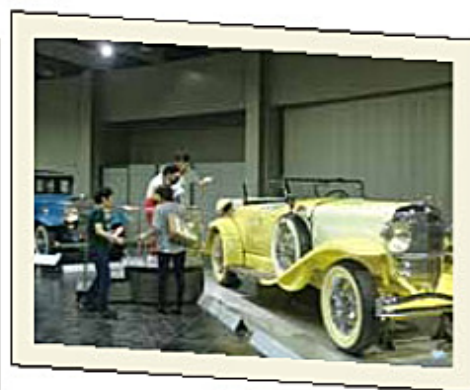
優雅なクラシックカーに興味深々