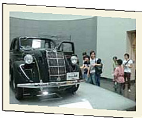
トヨタ自動車初の生産型乗用車トヨタ AA型 60年前はトヨタじゃなくトヨタだったんですね