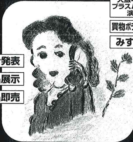
絵・田崎竜 下 防辰男