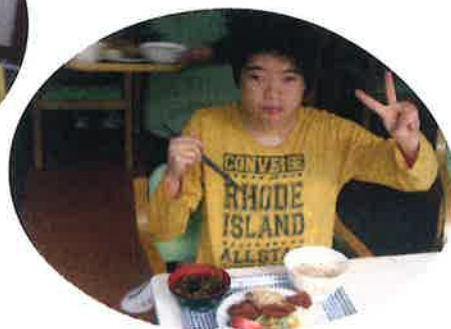
美味しいよとピースサイン