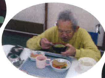
鯛茶そば美味しいかな？