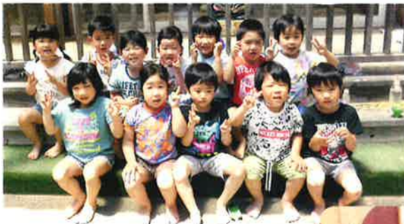
4歳児：みんな仲良し