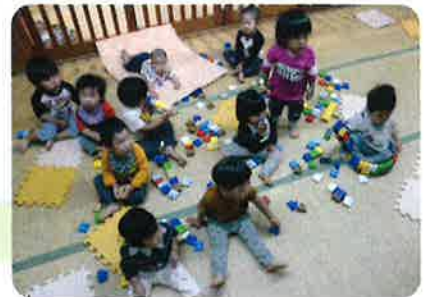
もも組：ブロック大好き