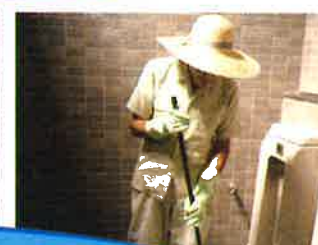
本郷駅・きのこの森・ぼーたる 赤礁崎オートキャンプ場・保健福祉センターなごみ等の清掃作業