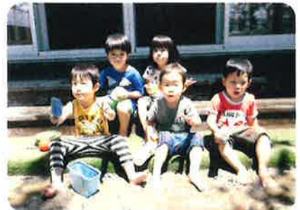
2歳児：泥んこ大好き