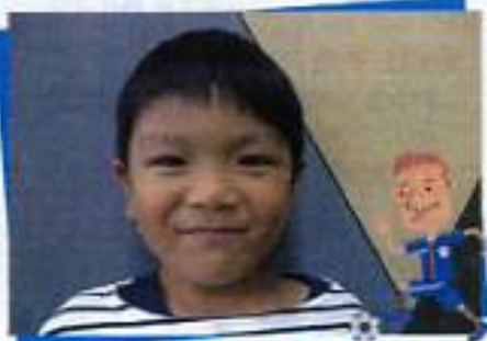
ふくい わくくん サッカー選手になりたいな