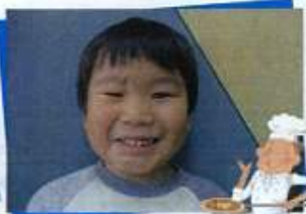
おか みくとくん ピザ屋さんになりたいな