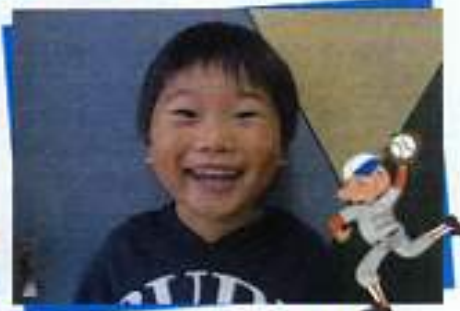
まえもと けいすけくん 野球選手になりたいな