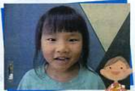
ふくしま さやちゃん パン屋さんになりたいな