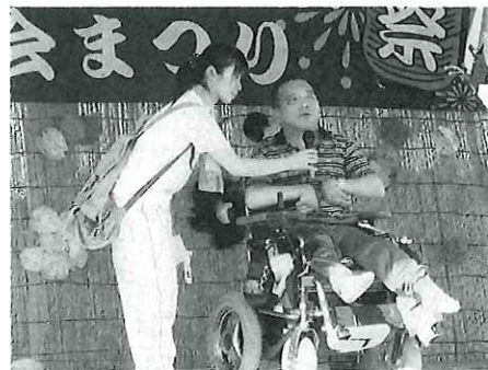
日ごろの練習の成果を、発表しました