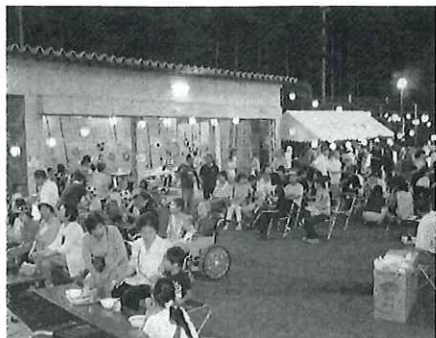
いよいよ友愛会夏まつりの開催です