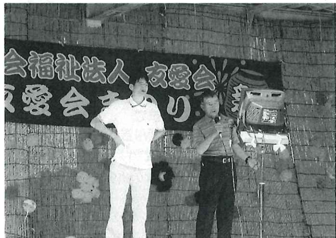
すてきな歌声が響きました