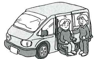
敬称は省略させていただきました。