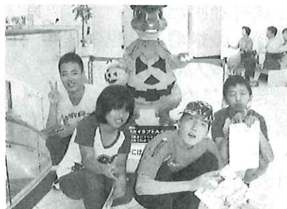
“勝山恐竜博物館”動く恐竜にドキドキ♡ ちょっと怖かったなー。