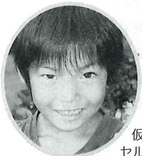
ますい きらりくん