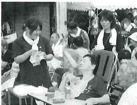
屋台の味を、楽しみました