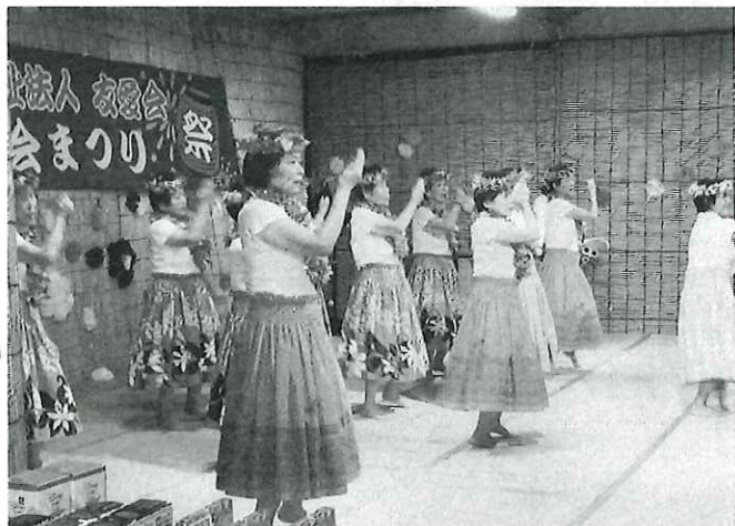
南国ハワイのように、ゆったりした時間が流れました