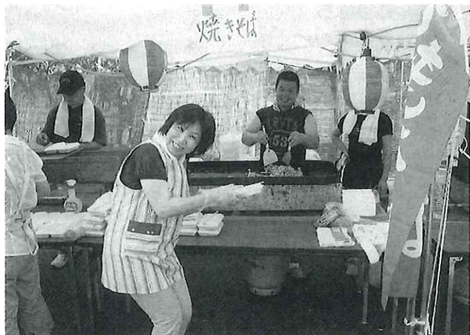
たくさんのお店が並びました