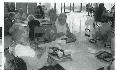
着て、個性ある手遊び等を披露してくれました。