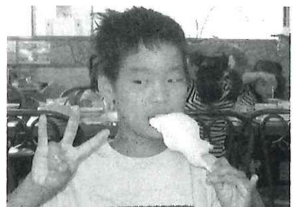
C班。バイキング堪能中です♪

今年はまだ試行段階ですが、利用者の評判が良ければ、今後も続けていきたいと思えます。