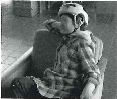
♡ A班。ゆったり、のんびり〜くつろぎ中です

りのんびりバス旅行”として、貸切りバスで三方へ行き、水族館見学や食事を楽しみました。