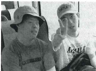
♡ B班。ドキドキワクワクの車中です。

メ”として、三方のホテルランチ〜熊川宿のくずまんじゅうまで、おいしい物巡りをしました。